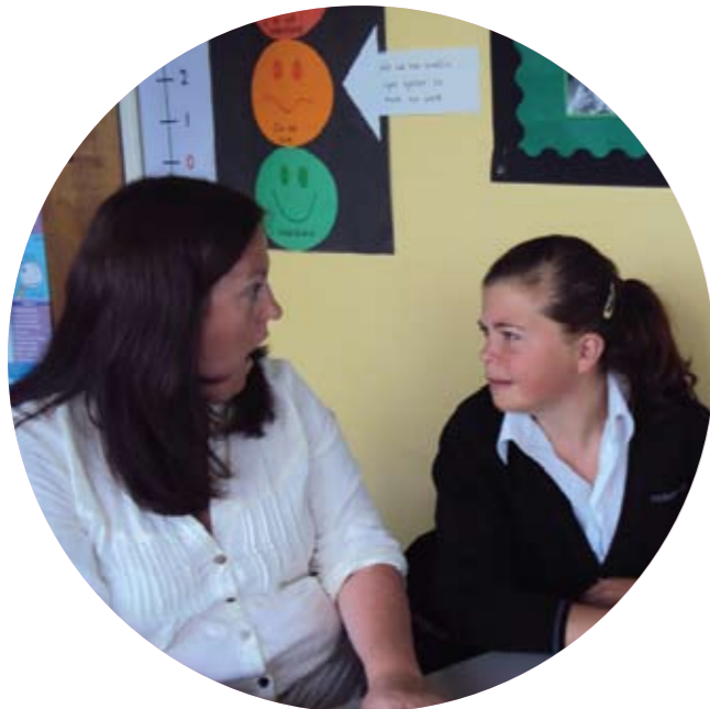
Prosiect Ymchwil Weithredu gan Glwstwr Pen-Y-Dre

Yn ôl Marilyn Sorenson PhD (2005) ' low self-esteem is frequently the root cause of many psychological, emotional, personal and relationship issues '. Felly, roeddem yn teimlo ei fod yn angenrheidiol gwerthuso hunan-fri'r plant ar adegau penodol yn ystod y cynllun. Gan ddefnyddio'r llyfryn adnoddau yn sail i'n proses werthuso, bu i ni lenwi arolwg a ddatblygwyd gan Coopersmith (1987) gyda'r dosbarth ar gyfnodau perthnasol o'r rhaglen. Bu i ni ddarganfod bod gan 66% o'r dosbarth well hunan-fri o ganlyniad i'r gwersi SEAL, roedd dyheadau'r rhan fwyaf o'r grŵp yn uwch na'u hymatebion cychwynnol, ac roedd 83% o'r plant nawr yn gwneud ymdrech fwy ymwybodol i feddwl am deimladau pobl eraill gan eu bod nawr yn gwybod sut i ddarllen iaith y corff syml pobl a'u tôn a'u hystumiau - a addysgwyd trwy gydol y rhaglen.